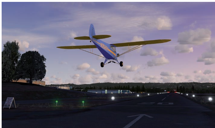
Anflug auf die 20 von Twin Oaks - bei Tag und in der Abenddämmerung ein Erlebnis!

Benutzer von Windows Vista und Windows 7 64 Bit sollten die Benutzer-