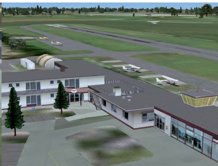
Atlas Airfield bietet land- und luftseitig viel fürs Auge.