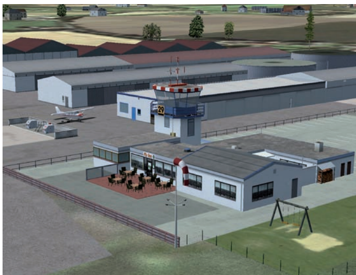
Tower, Tankstelle, Restaurant und Hangars von Damme.

Die Box, die Ende April erschien, kostet 29,99 Euro und kann bei den "üblichen Verdächtigen" des Fach- und Fachver- sandhandels bezogen werden.